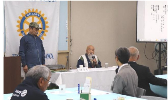
樋笠名誉会員より客話者の紹介