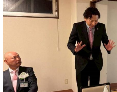
両会長 どちらも若い