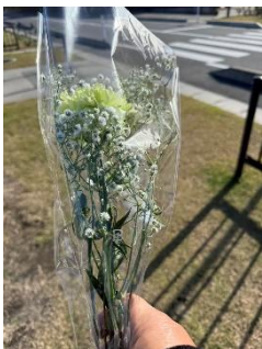
震災にて被災した大川小学校の慰霊碑 献花 (観光組)