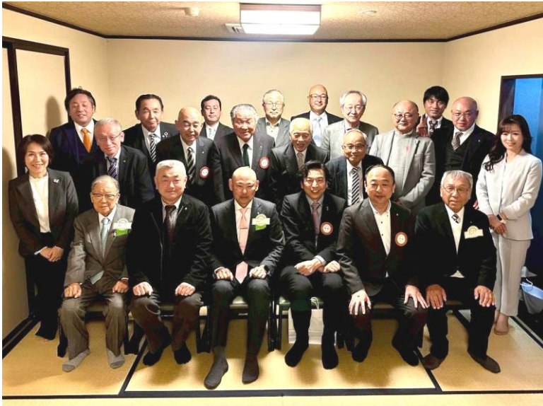
石巻南 RC 例会訪問記念 2025.11.1