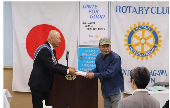
山下会長よりお礼の記念品を