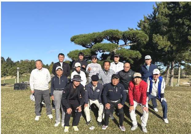
合同親睦ゴルフコンペ(ゴルフ組)