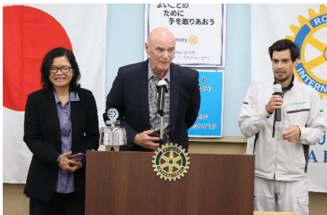
グレン・ファフ会員

*チェンマイ RC の活動資料を配布しました。 ご覧になりたい方は事務所にあります。