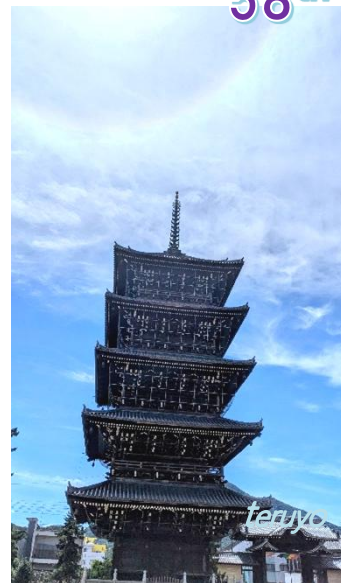
総本山善通寺五重塔