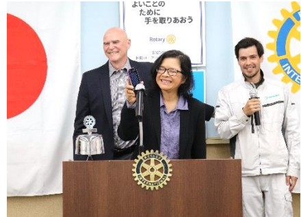
ウサー・スラカーン会員